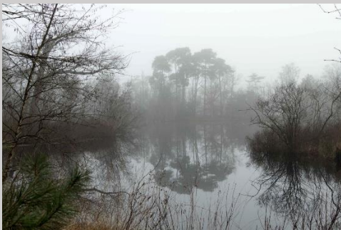
De 2 de plaats is voor Ton.

Deze opname is gemaakt aan de rand van het Belversven. Het was rond 11 uur nog koud en mistig (zoals te zien op de achtergrond). Het zand op de voorgrond leidt je ogen verder de foto in via de bomen zowel links als rechts naar uiteindelijk de bomen op de achtergrond. De tak rechtsboven in de foto zorgt voor een dieptewerking. De foto is gemaakt met een Canon EOS 90D met een 18-135mm lens (50mm), een diafragma van 11, een sluitertijd van 1/50 en ISO 160. Witbalans op bewolkt. Er is gebruik gemaakt van een statief (met waterpas) en de foto is niet nabewerkt.